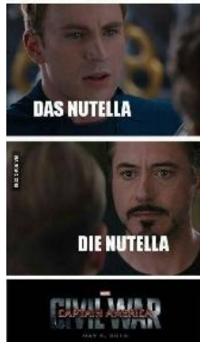
Gambar 2. Data 1