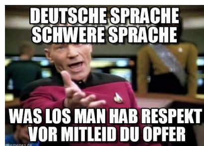
Gambar 5. Data 2

Selain itu, terdapat pula meme yang membahas kesulitan bahasa Jerman secara keseluruhan seperti meme pada data 2, data 5, dan data 7. Kesulitan bahasa Jerman dalam meme tersebut disampaikan tidak terfokus pada satu faktor, melainkan hanya pernyataan bahwa bahasa Jerman adalah bahasa yang sulit. Berikut ini adalah meme yang membahas kesulitan bahasa Jerman secara keseluruhan: