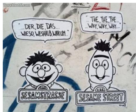
Gambar 4. Data 9

Adapun meme yang membahas mengenai kosakata dalam bahasa Jerman adalah meme pada data 9 dan data 10. Kedua meme ini menggunakan permainan kata untuk menggambarkan humor yang terdapat di dalam meme. Berikut ini adalah meme yang membahas mengenai kosakata dalam bahasa Jerman: