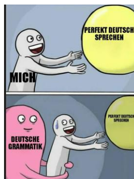
Gambar 3. Data 4

Pada pembahasan mengenai kesulitan Grammatik , digambarkan dalam meme pada data 3, data 4, dan data 6. Pada data 3 dan data 4 humor disampaikan dengan kata kiasan, sedangkan pada data 6 humor disampaikan dengan penggambaran yang berlebihan. Berikut ini adalah meme yang membahas mengenai Grammatik :